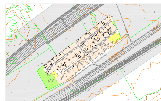
URBANIZACIÓN GRAN TORRUBIA